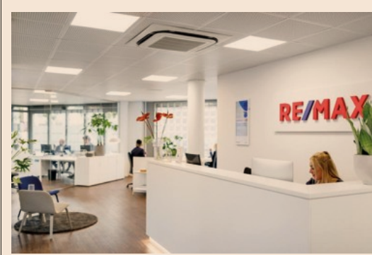
RE/MAX. Agenzia, interno