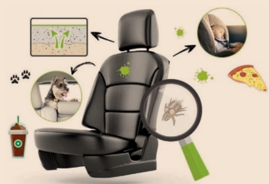
Ecoline Wash. La sanificazione a vapore igienizza e garantisce un livello di pulizia eccellente

Ad oggi la rete franchising di Ecoline Wash conta circa 150 punti in 15 paesi e conferma costantemente la propria crescita in Europa e non solo. La metodologia impiegata dagli affiliati sposa il concetto di sanificazione approfondita degli interni al valore imprescindibile del rispetto dell'ambiente, prestando la massima cura ed attenzione alle necessità del cliente. Sfruttare il potere igienizzante del vapore permette di eliminare qualsiasi traccia di sporco da tutte le superfici e di poter lavorare su qualsiasi veicolo sia internamente sia esternamente, senza alcun rischio né danno per carrozzerie, interni in pelle o tessuto.