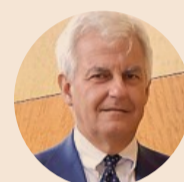
ALESSANDRO PROFUMO Amministratore delegato di Leonardo