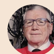
MASSIMO INGUSCIO Presidente del Consiglio nazionale delle ricerche