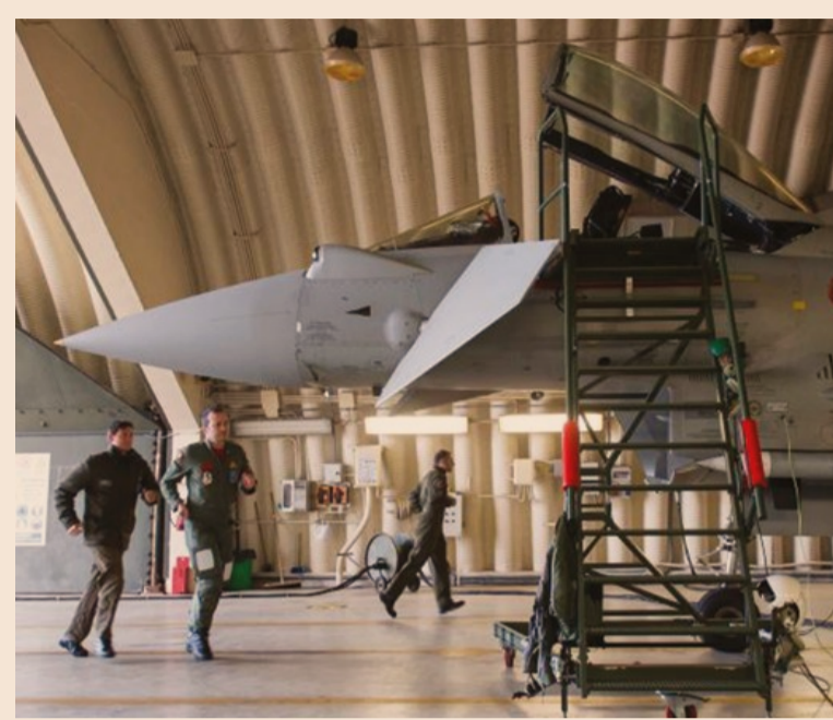
Super caccia. Sviluppato in collaborazione tra Italia, Uk, Germania e Spagna, l'Eurofighter Typhoon è il più avanzato caccia multiruolo disponibile sul mercato. Leonardo partecipa al programma con le divisioni "velivoli" ed "elettronica"