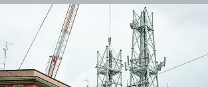
Un'antenna per la trasmissione del segnale di telefonia mobile