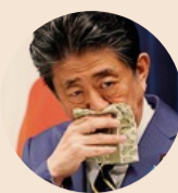
Senza precedenti. Il Giappone, terza economia al mondo, adotterà un pacchetto di misure che il premier Shinzo Abe (nella foto) ha definito ieri «colossale e potente». Senza entrare nei dettagli, Abe ha parlato di stimoli fiscali, strumenti monetari e agevolazioni per le imprese

Nei fatti è uno strumento preventivo contro i licenziamenti nelle imprese sottoposte dalla crisi a for-