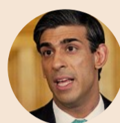
Sorpresa Uk. Il cancelliere dello Scacchiere Rishi Sunak ha presentato nei giorni scorsi un importante piano di sostegno per i lavoratori dipendenti: lo Stato coprirà l'80% dello stipendio nelle aziende in crisi

L'esborso fu notevole, circa 10 miliardi di euro, e si presume che